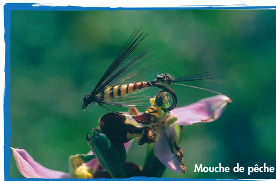
Mouche de pêche