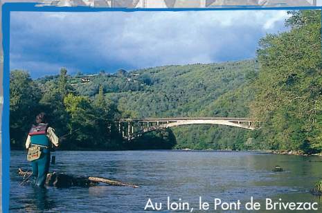
Au loin, le Pont de Brivezac